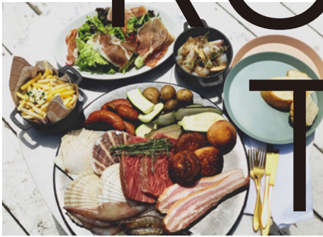
4名様イメージ *魚介類はオプションになります。